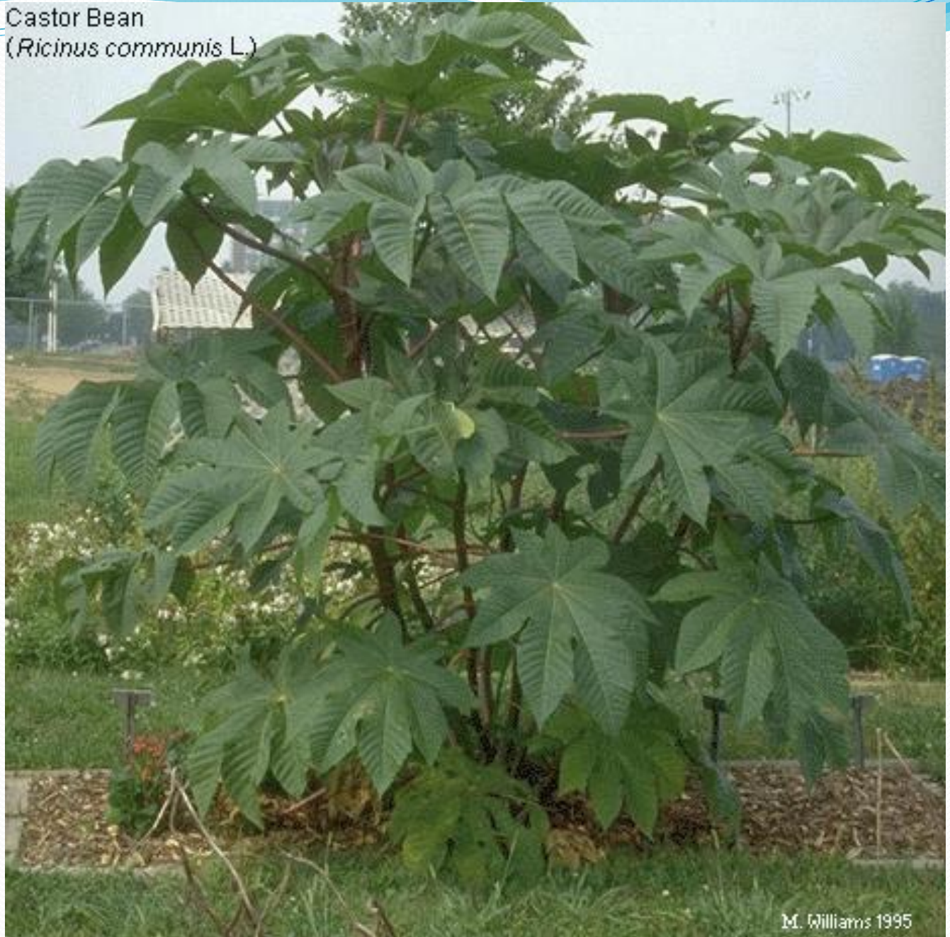
Castor Bean ( Ricinus communis L.)