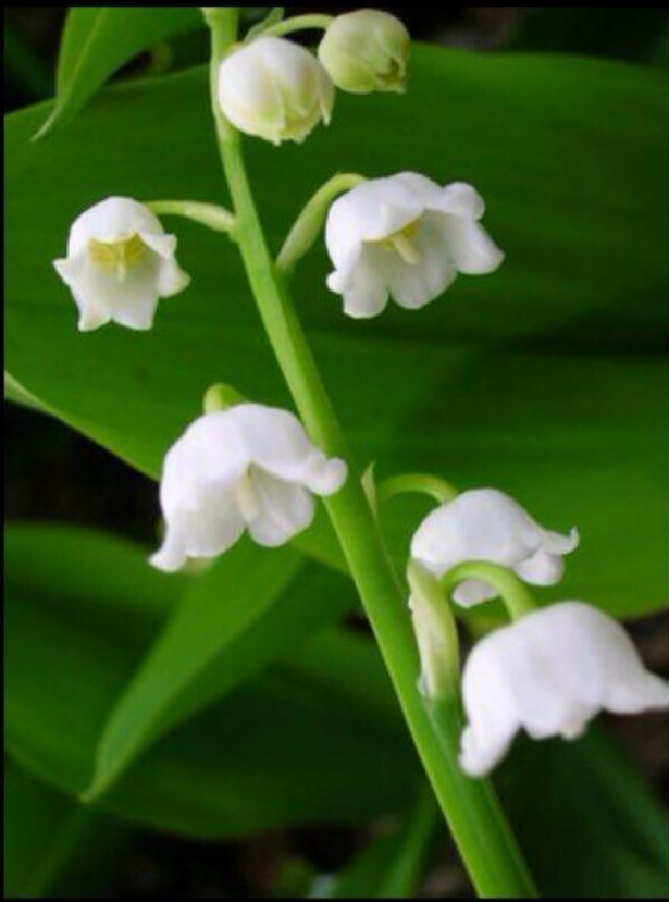
Lily of the Valley [10064] - $14.50 : Raven Essences... ravenessences.com 300 x 401