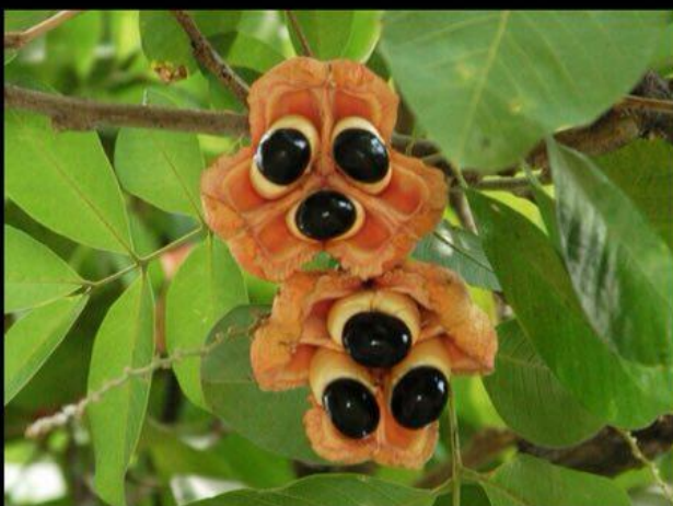
Jamaican National Fruit – Ackee