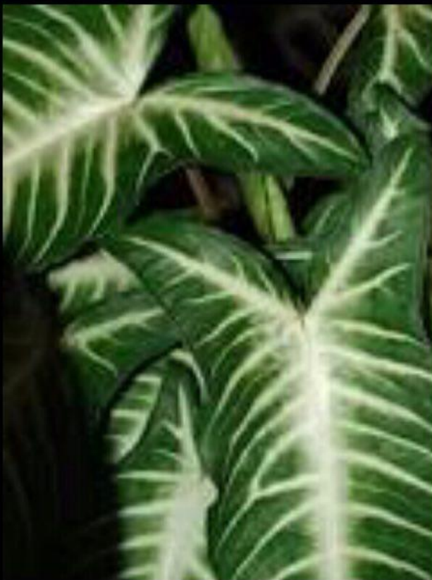
Kaladium – Wikipedia, wolna encyklopedia pl.wikipedia.org