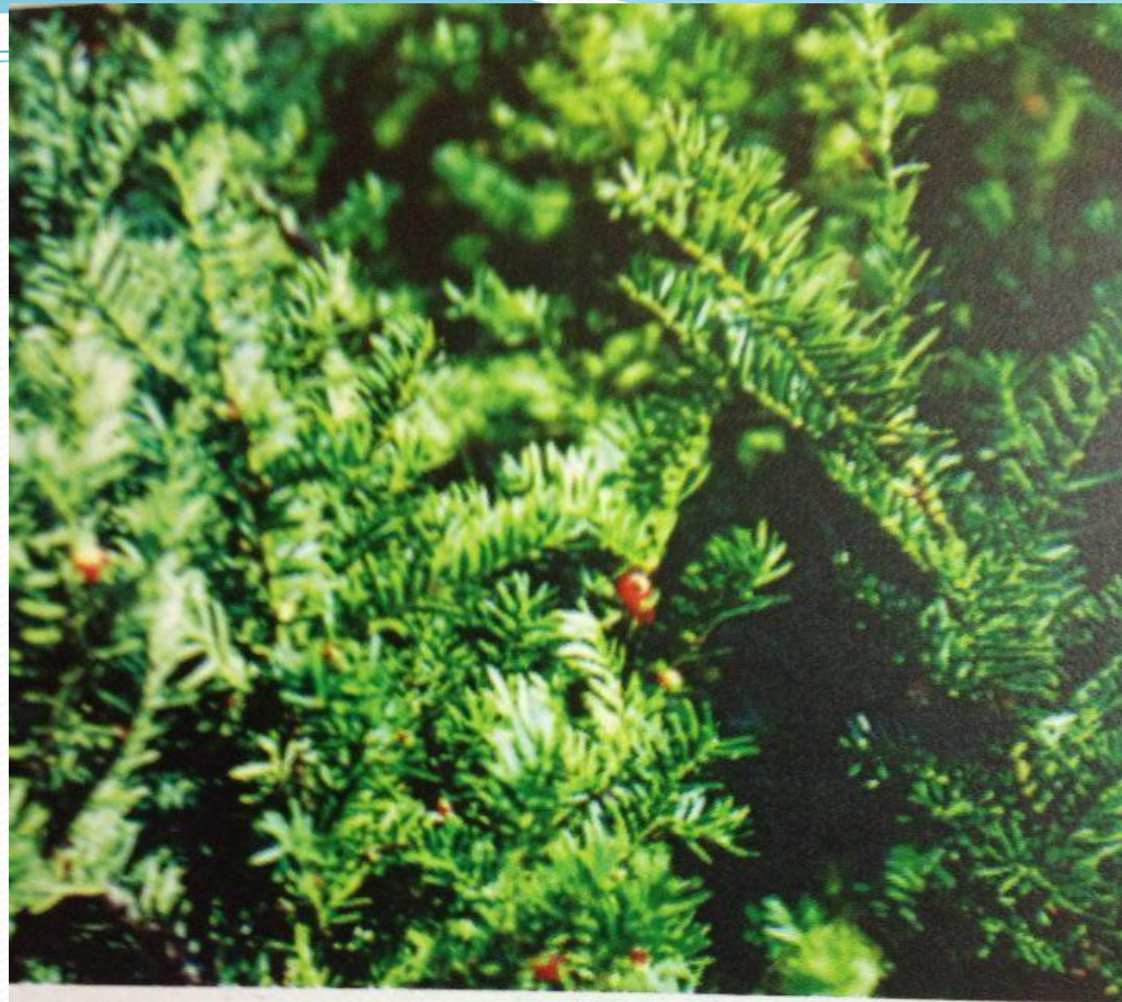
Figure 164-8. Taxus (yew).

ility (sodium channel openers), causing cardiova bradycardia and hypotension) and gastrointestinal vomiting, and abdominal pain) effects. Although a few leaves is unlikely to cause symptoms, larger expo se severe toxicity. In addition, the