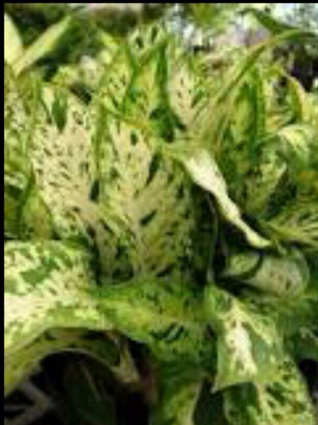
BioLib - Image - Dieffenbachia seguine ( biolib.cz