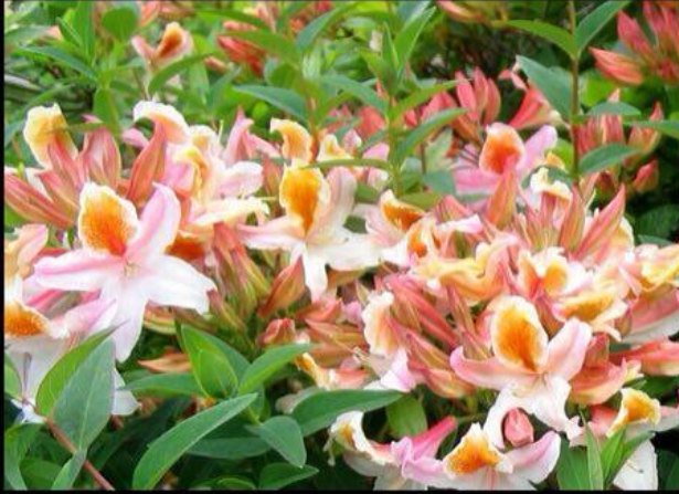
Deciduous Azaleas mooseycountrygarden.com